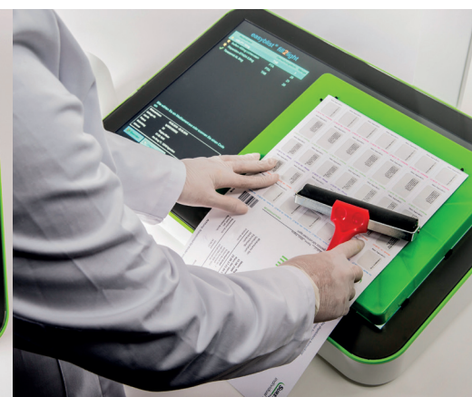
6 Schritt Blisterkarte verschließen