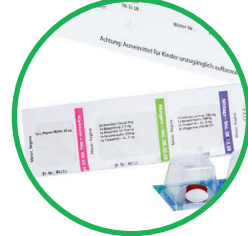
Sehr übersichtlich: Deutlich markierter Wochentag und Einnahmezeitpunkt sowie Patienteninfo auf jeder Kammer

FERTIGE BLISTERKARTE Kompatibel mit allen Omnicell Blisterkarten 7x4 und 7x5