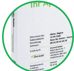
Patienten- und Apothekeninformationen auf der Kartenvorderseite