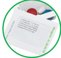
Arzneimittelinformation auf jedem Einnahmezeitpunkt