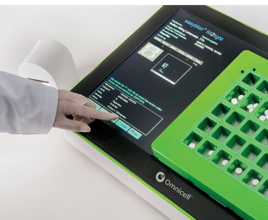
4 Schritt Fotodokumentation auslösen