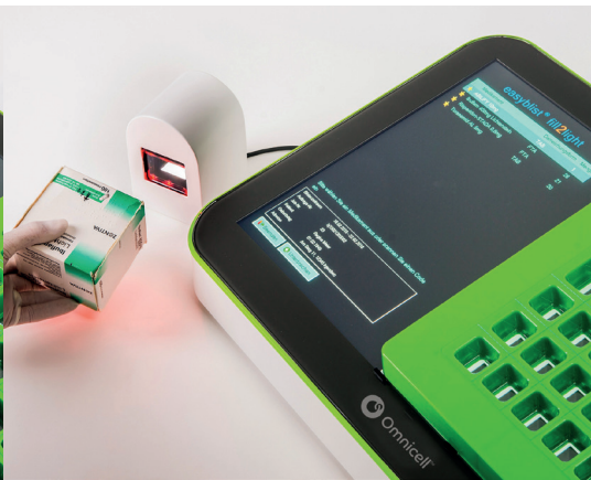
2 Schritt Medikament scannen