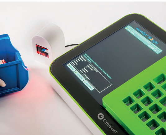
1 Schritt Patient scannen