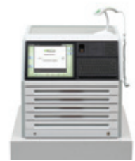
Table Top Cabinet