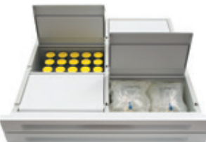
6-Fächer-Schublade mit doppelter Tiefe

6-Fächer: Größter Verschlussbehälter der Branche—verwahrt IV Beutel und andere große Artikel.