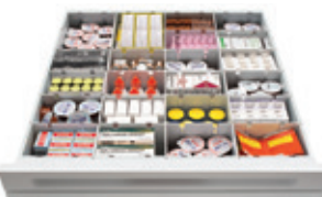
24-Fächer-Schublade mit doppelter Tiefe